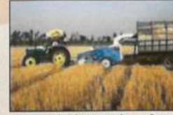
फसल अवशेष से भूसा बनाने का परिदृश्य