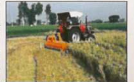
खड़ी फसल को प्रबंधन करने हेतु यंत्र