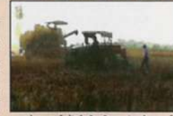
खड़े नरवाई में हैप्पी सीडर यंत्र से बुवाई