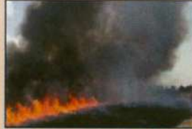
खड़ी फसल को प्रबंधन करने हेतु खंज