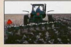
फसल अवशेषों को मिट्टी में मिश्रित करना