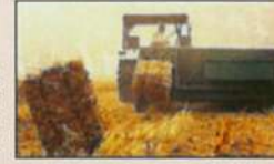
रूटी बैलर मशीन द्वारा फसल अवशेष का ब्लाक बनाने का दृश्य