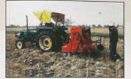
फसल अवशेषों को भूमि के तहत पर रखकर हैप्पी सीडर से बुवाई