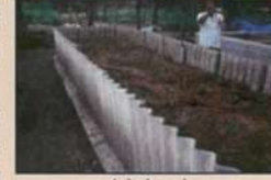
फसल अवशेषों से कम्पोस्ट बनाना