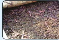
खरपतवारिक धान से वर्मीकम्पोस्ट