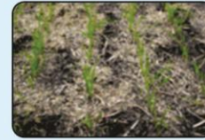
गेहूं में खरपतवारिक धान का मलच